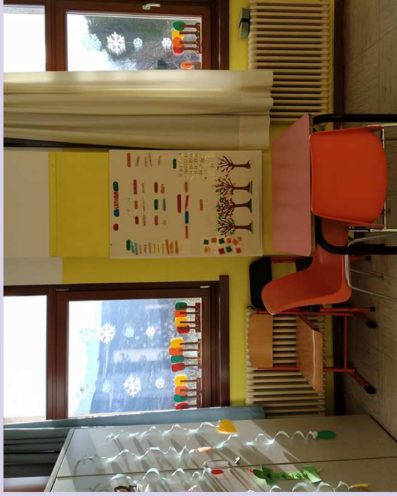
Aula per il lavoro individualizzato